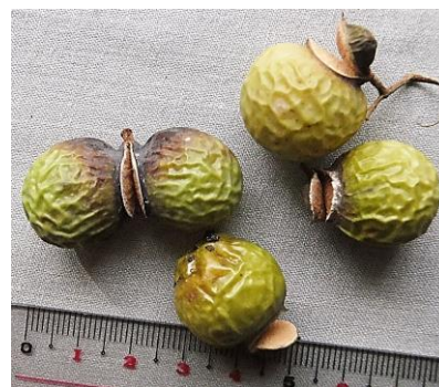
ムクロジの実 10/14 白川で